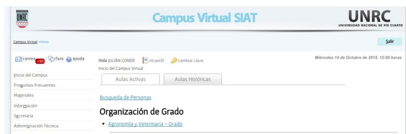
Figura 2 - Página inicio EVEA SIAT - Inicio del Campus

Una de las características principales es la flexibilidad en las modalidades de uso. Para dar soporte a esto, se cuenta con un mecanismo que posibilita seleccionar las herramientas a utilizar por cada propuesta académica (pizarrón, agenda, actividades, noticias, foro, materiales, etc.), y roles de usuario. A su vez, en cada propuesta se pueden definir los roles a utilizar, es decir, tipos de usuario que intervienen (alumnos, tutores, responsables, veedores, administrativos, observadores, invitados, etc.). Cada rol contiene los permisos de acceso y uso sobre cada herramienta utilizada (solo lectura, lectura/escritura o no visualizada). Finalmente, a cada usuario se le pueden asignar diferentes roles, dependiendo de la propuesta en la que participe.