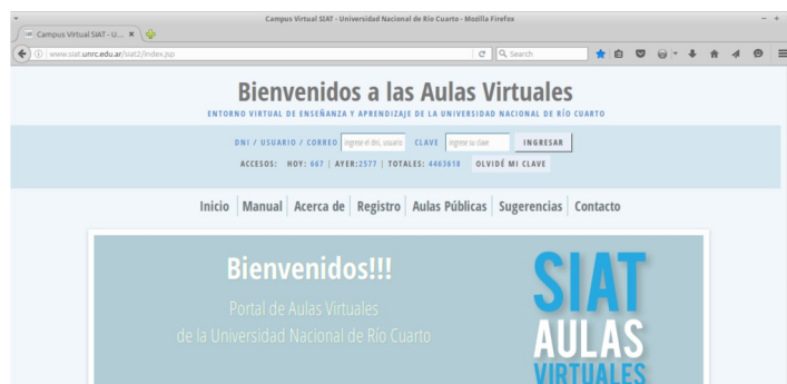
Figura 1. Página de acceso al EVEA SIAT: www.siat.unrc.edu.ar

El entorno virtual SIAT posee diferentes niveles de jerarquías que estructuran la organización y el predio educacional, al igual que sucede en la Universidad presencial. Es decir, SIAT es un espacio virtual que está compuesto por distintos niveles o secciones, en donde cada uno tiene sus funcionalidades y objetivos. Mencionaremos dichos niveles en orden de abarcado, de mayor a menor, éstos son: Campus, Organizaciones (Facultades o Carreras), Materias (o Aulas), Comisiones y Grupos [4].